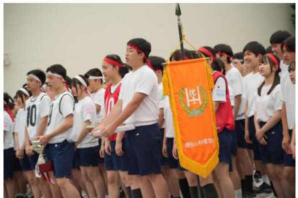
齐唱校歌 圆满闭幕