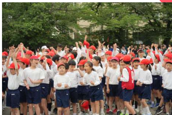
本学年度 红组获胜！