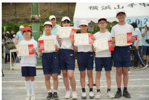
小四五六赛跑获奖学生