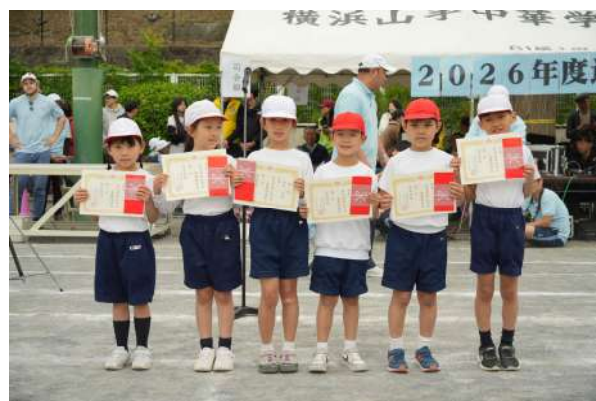
小一二三赛跑获奖学生