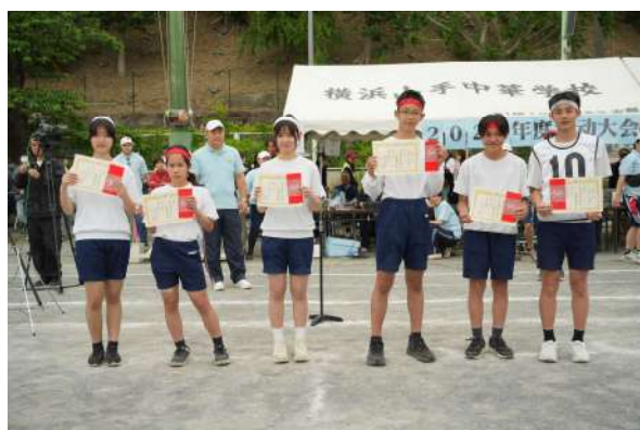
中学部赛跑获奖学生